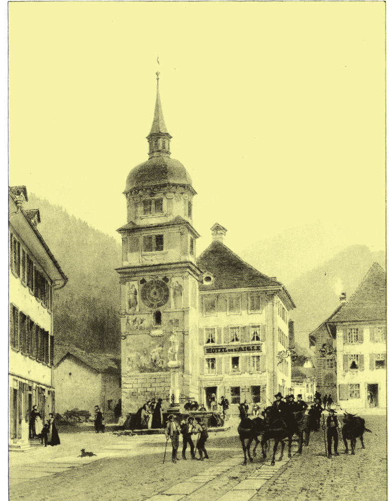
Altdorf anno 1850